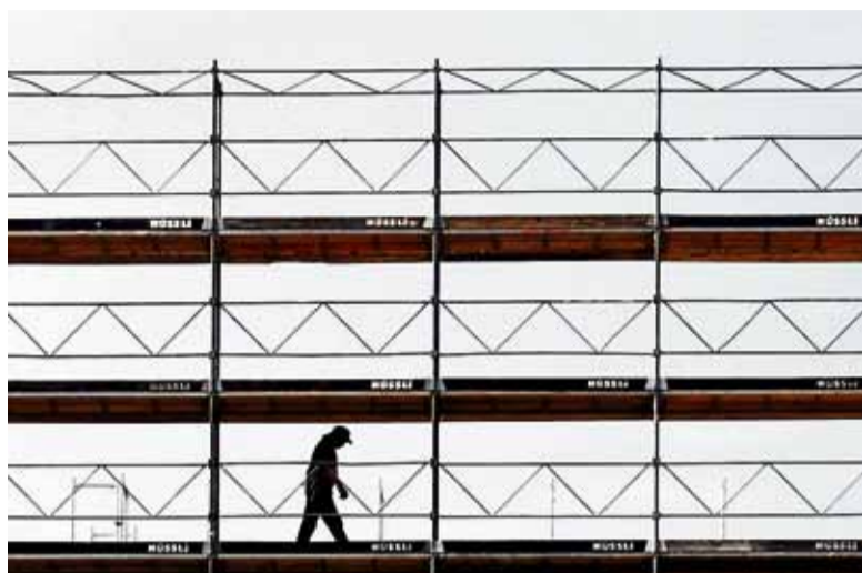
I due kosovari erano il titolare e il direttore di una ditta di ponteggi.

Mentre procede senza sosta il lavoro degli inquirenti per fare chiarezza sul caso dei “permessi falsi” scoppiato all'interno degli Uffici della migrazione, piovono denunce contro “i corvi” che avrebbero inviato una lettera anonima ai capogruppo dei partiti in Gran Consiglio e ad alcuni giornalisti. Tre le denunce scattate ieri per calunnia e diffamazione alla lettera dei tre che si sono firmati «dipendenti dell'Ufficio in questione» in cui si denunciava «la vergogna dell'Ufficio della migrazione». A presentare la denuncia contro ignoti sono stati l'ex e l'attuale capo ufficio e uno dei funzionari più volte citati dagli autori dello scritto anonimo. Nella lettera - definita dal direttore del Dipartimento delle istituzioni Norman Gobbi infangante - gli autori elencavano alcune presunte lacune con una certa dovizia di particolari, lamentandosi del clima e della confusione all'interno dell'Ufficio